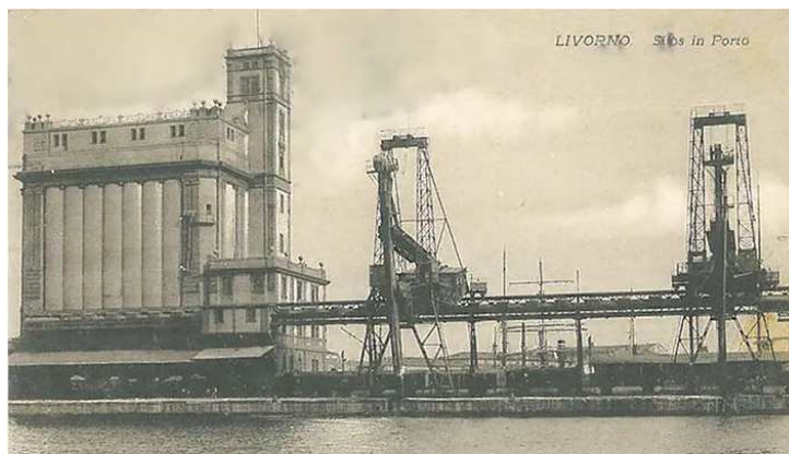
Una delle prime immagini del Silos del 1924 in piena attività (cartolina spedita nel 1926).